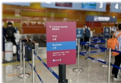
空港のキャセイパシフィック航空と同じサービス、二貫した顧客サービス