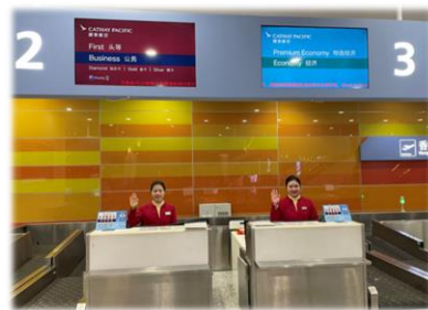
キャセイパシフィック航空の制服を着たスタッフの専用のチェックインカウンター