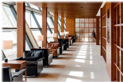
✓ 270度の海の景色 ✓ およその面積 450平方メートル、70席