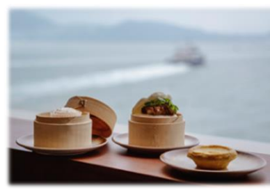
✓ CXの注目のお食事と飲み物 ✓ 香港国際空港路線の待機エリア内に位置