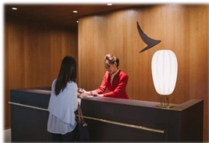
キャセイ初の空港外ラウンジであり、香港国際空港に到着する前でも、蛇口ラウンジで最初のリラックスしたひとときをお楽しみいただけます。