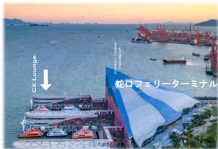
2024年1月に深セン蛇口フェリーターミナルに新しいキャセイルoungeがオープンしました。

営業時間：07:30～20:15 (フェリーの運航スケジュールによって変更あり)